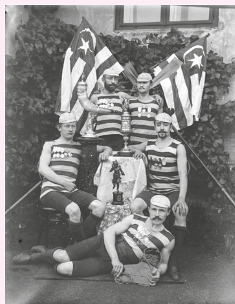
▲ Členové Veslařsko-bruslařského klubu Ohře, ověnění prvními úspěchy na konci 19. století. Velký pohár uprostřed získali 15. července 1894 v Praze na Mezinárodních veslařských závodech pořádaných Veslařským klubem Blesk Praha.

▼ Pohled na Louny od jihu kolem roku 1892. Foceno z místa nedaleko dnešního Tyršova náměstí. Poděbradova ulice tehdy ještě nestála. Zajímavý je zvláštní reliéf krajiny, který dnes již nespatříme.