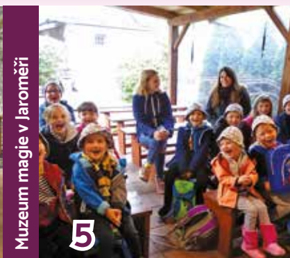
Muzeum magie v Jaroměři