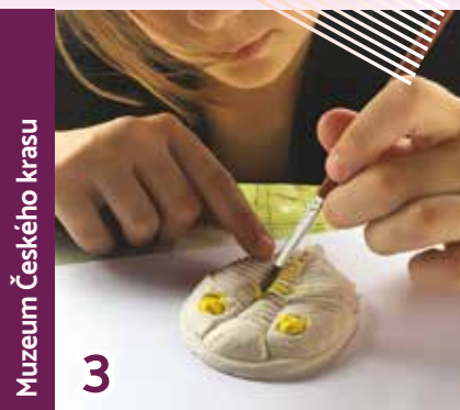
Muzeum Českého krasu