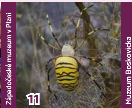
Západočeské muzeum v Plzni