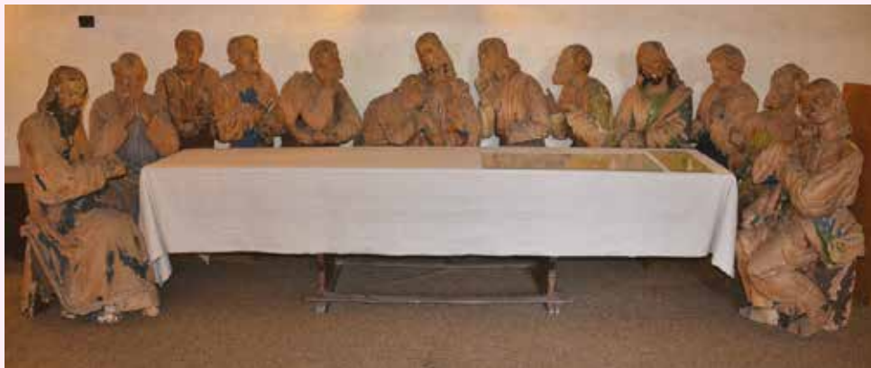
Sousoší Poslední večeře Páně v životní velikosti v klášterním refektáři