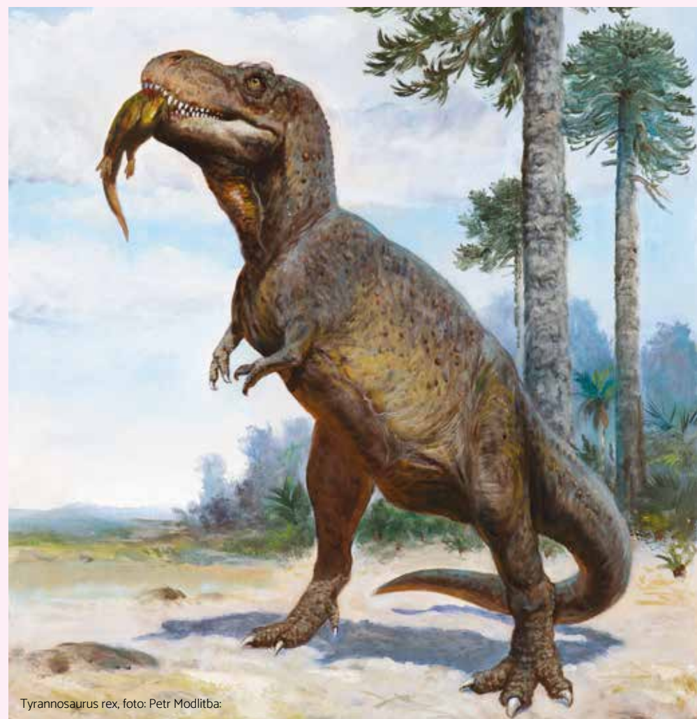
Tyrannosaurus rex

Mostecké muzeum sídlí v památkově cenné budově bývalého Státního reálného gymnázia z roku 1913. Jedna z největších muzejních institucí Ústeckého kraje se věnuje zejména přírodě, umění, kultuře a historii Mostecka i Litvínovska.